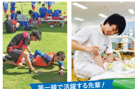
第一線で活躍する先輩！