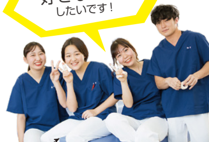
スポーツトレーナーを目指す柔整学科の学生の皆さん