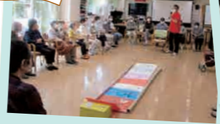
レクリエーション大会